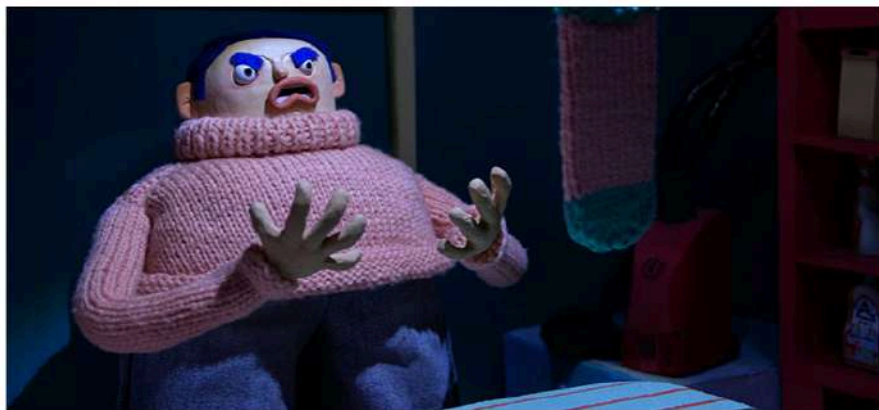
Une de perdue © Ecole Emile Cohl

Ouvert à tous les publics, des plus avertis aux amateurs, des professionnels aux familles, le Carrefour du cinéma d'animation ouvrira les portes de sa 18 ème édition le 8 décembre prochain (et jusqu'au 12 décembre). Au fil des ans, l'événement est devenu le rendez-vous