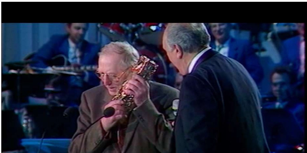
L'animation Française, cet autre cinéma © Mickael Royer, Theorem, 2021

Il y a cette volonté politique – et financière... car tout passe essentiellement par l'argent – qui fait naître quelque chose qui perdure encore et qui a clairement pris un essor positif. Pour le documentariste que je suis, c'est un bel exemple à analyser et à montrer.