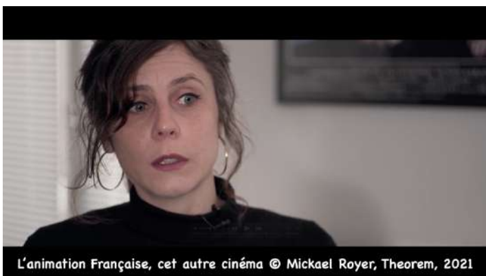
L'animation Française, cet autre cinéma

On voit une nouvelle révolution venir, une tectonique des plaques qui ne touche pas que l'animation mais tous les secteurs du cinéma et de l'audiovisuel : la politique des années 80, aussi brillante qu'elle ait été, commence à apparaître un peu obsolète aujourd'hui, avec les nouvelles pratiques de fabrication et de consommation de la culture. Un recalage de cette politique va arriver. Il y a clairement une évolution de l'informatique qui continue et qui change beaucoup de choses.