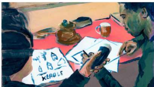
recherche pour "Les frontières d'Amadou O."

La 6 ème édition des rencontres "Documentaire & Animation" est reportée aux 24 et 25 mars 2022 à Marmande . Le programme complet sera bientôt disponible. Lors de cette édition, seront notamment évoqués les projets : L'extraordinaire périple de Magellan (F. de Riberolles), Suzanne (A. Caura et J. Oosterlinck), Sur le pont (S et F. Guillaume), Les frontières d'Amadou M. (C. Lacombe) ... Le film Ma famille afghane (M. Pavlatova) sera aussi projeté en avant-première.